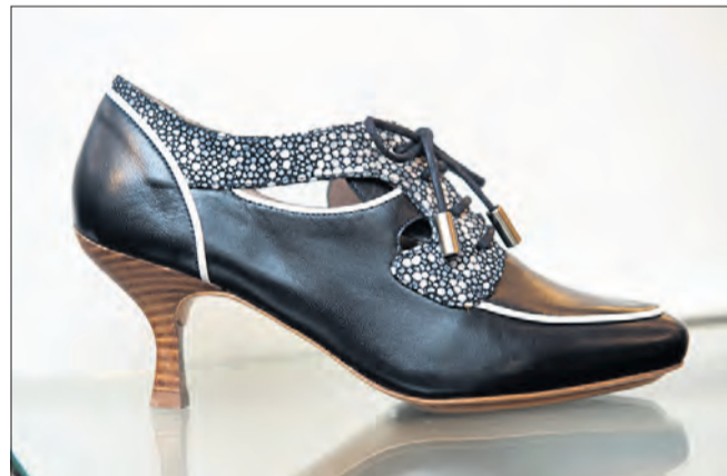
Byen San Francisco har lagt navn til denne sko.

Barbros opskrift på den optimale damesko er en hæl på højst 6,5 centimeter, hvis skoen er en størrelse 38. Der-